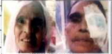
PASTE PHOTO HERE

FATHER'S/SPOUSE'S NAME: Ramkhaladi पिता/कटुम्भ का नाम